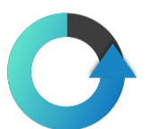
ILUSTRACIÓN Y DISEÑO